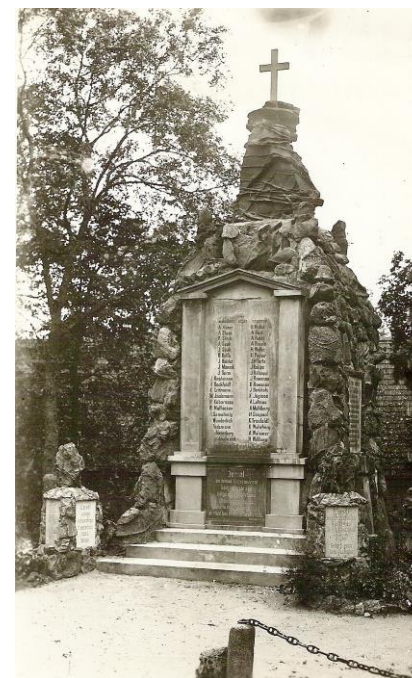
Kadrina kihelkonnast pärit langenutele mälestuskalju – Gustav Beermanni looming.