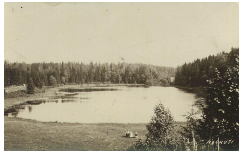
Neeruti Eesjärv XX sajandi I poolel, mil vaade järvele oli veel sinna hiljem kasvanud puudest varjamata.

Ostes käesoleva trükise, toetate Neeruti ja selle lähikonna loodushoidu, kultuuriloo jäädvustamist ja Neeruti Seltsi, mis selle nimel ellu on kutsutud.