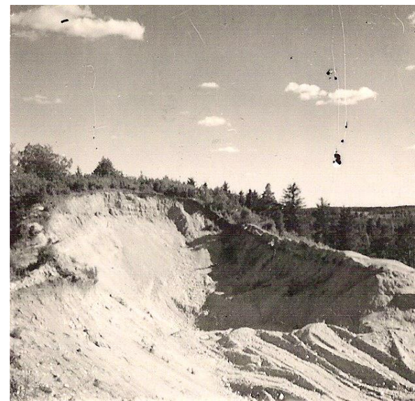
Eestlaste muistne linnusease Linnamägi veeti 1950ndate aastate algul Tapa sõjaväelennuvälja ehituseks.